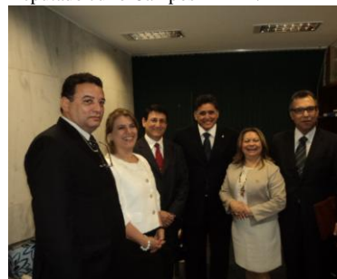
Deputado Jânio Natal Líder do PRP/BA