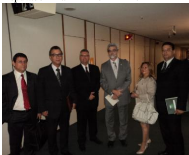
Deputado Pedro Eugênio – PT/PE