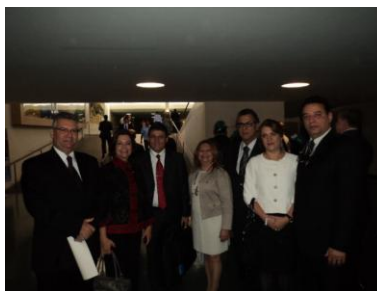
Deputada Ana Arraes Líder do Bloco PSB, PTB, PCdoB