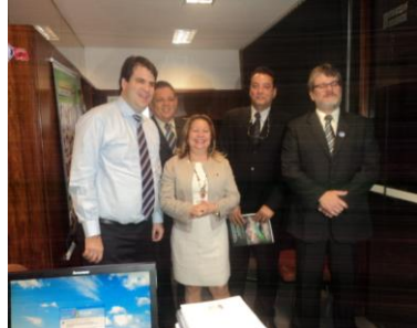
Deputado Áureo Melo Líder do PRTB/RJ