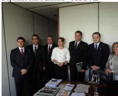
Deputado Renan Filho – PMDB/AL