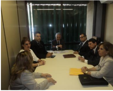
Deputado Rubens Bueno Líder do PPS/PR