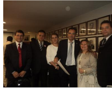
Deputado Del. Protógenes – Pcdob/SP