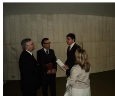
Deputado Rui Palmeira – PSDB/AL