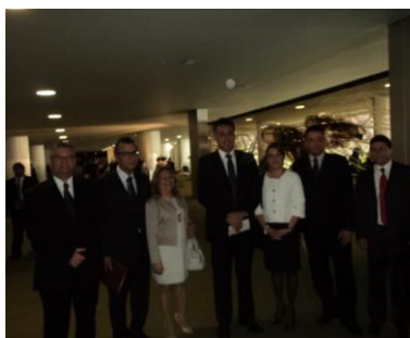
Deputado Guilherme Campos -