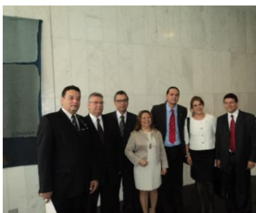
Deputado Weliton Prado – PT/MG