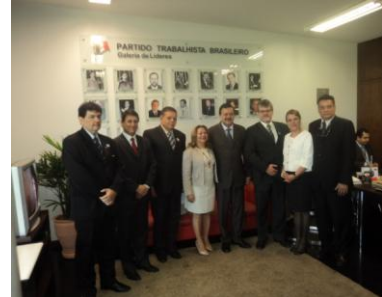
Deputado Jovair Arantes Líder do PTB/GO