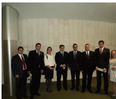
Deputado Rui Palmeira – PSDB/AL