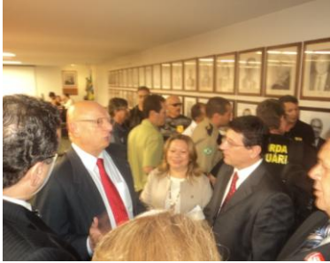
Deputado Esperidião Amim – PP/SC