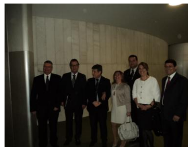
Deputado Mendes Ribeiro – PMDB/RS